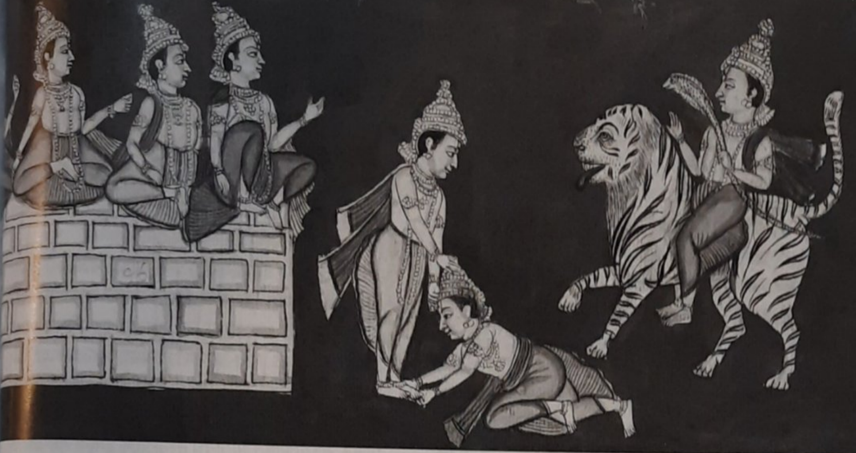
ज्ञानदेव चांगदेव भेटीचं मराठा शैलीतलं पोथीचित्र

संप्रदायात ग्रंथनिर्मिती करणं सोपं नव्हतं. एक वैष्णव तर दुसरा शैव. त्यात नाथ संप्रदायातलं अमूल्य तत्त्वज्ञान वेचून वारकरी संप्रदायाचा पाया रचणं महाकठीण. त्यामुळं एका दुव्याच्या शोधात दोन्ही होते. एक संप्रदाय शिष्याची तर दुसरा गुरूची वाट पाहत होता. नियतीनं टाकलेल्या फाशामुळं हा शोध संपला.